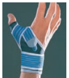
STRAPPING POUCE 0332