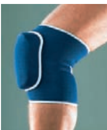
GENOUILLÈRE DE PROTECTION 679