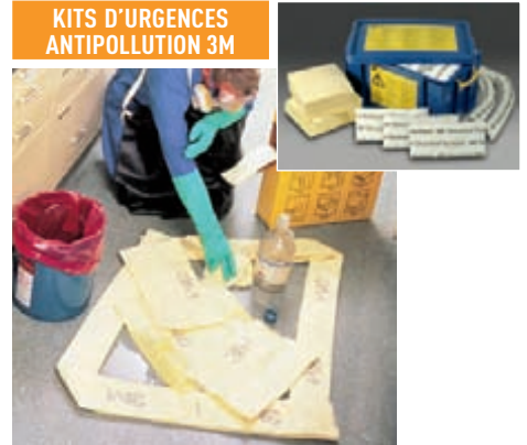
KITS D'URGENCES ANTIPOLLUTION 3M

3M™ P300 Absorbant Produits Chimiques Oreiller