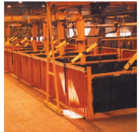
CABINES DE SOUDURE