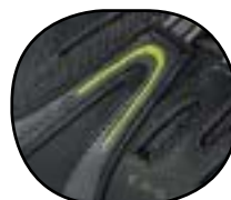
Tige ventilée et block up